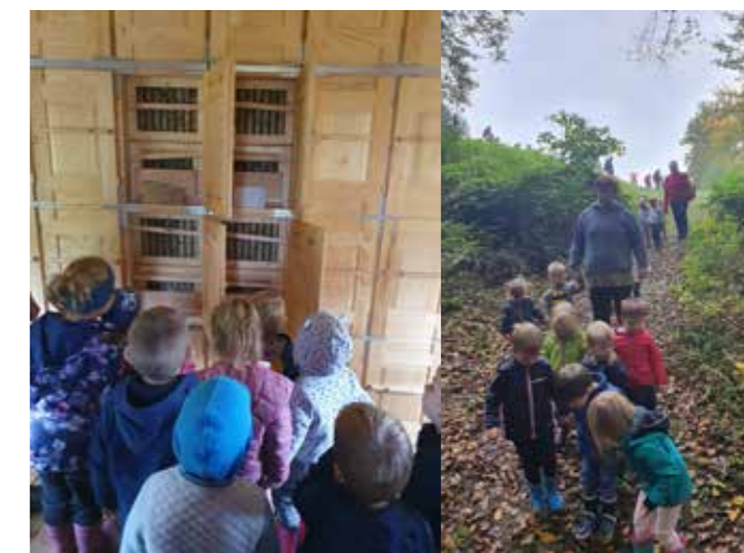
← Lucija Velički

in kar nismo mogli verjeti, da sta minili že dve uri. Po učilnici na prostem se spustimo do parkirišča, še pogled na ovce in jagenjčke in že se znova veselimo vožnje z avtobusom. Lepo nam je bilo v sončnem raju, še pridemo kdaj.